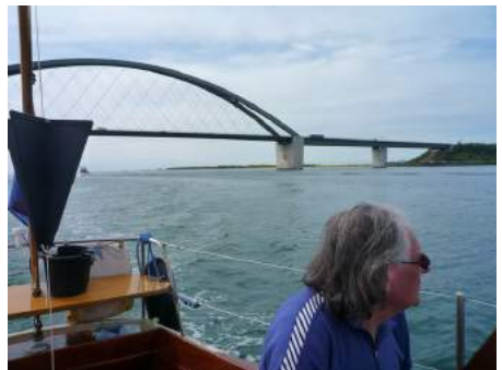
Op de Oostzee

Als je zo lang en veel vaart kom je natuurlijk wel eens in situaties terecht waar je later met kromme tenen