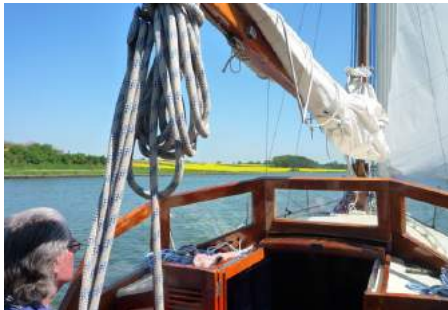
Varend op de Eider.

aan terug denkt. Zo kwamen we eens terug van de Oostzee en wilden van Cuxhaven naar Wangerooge. Het was eendenkukeltjesweer en een bezeilde wind. Eenmaal in de druk bevaren scheepsroute Jade-Elbe-Weser trok de lucht dicht en werd het stommig. We hoorden de scheepstoeters blazen en konden werkelijk niet bedenken uit welke richting het geluid kwam. Het leek van alle kanten te komen. Dus: motor uit en luisteren! Toen plotseling werden we per megafoon opgeroepen door de Duitse waterpolitie. 'U vaart een gevaarlijke koers, ga naar kanaal 10'. Zo gezegd, zo gedaan. We volgden de door de politie opgegeven koers naar hen toe: dus vol gas. Achterom kijkend zagen we een enorme grijze muur achter ons langs schuiven. Daar droom ik nog wel eens van als ik zwaar