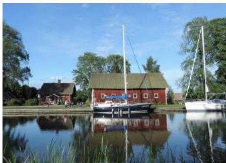
Afgemeerd in Hasjtörp.

Het is al weer een zonnig dag als we losgooien. Een Zweeds zeiljacht sluit aan, even geen sluisen maar wel bruggen. Het laatste stukje vaarwater heeft hele smalle doorgangen en onze Zweedse zeiler gaat heel voorzichtig voorop tot we bij het Viken meer zijn.