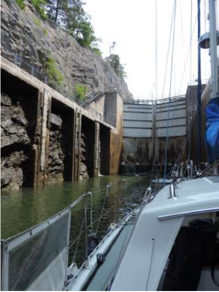
Indrukwekkende sluis in TrollHättankanaal.

ren verder door het fraaie landschap naar de grote Trollhättan sluisen. Het sluisencomplex ligt tussen de rotsen in geklemd en ziet er zeer spectaculair uit. Aan de oost-zijde van de sluis maken we in het midden vast bij een trap. Ook nu gaat alles heel beheerst. In de 3e sluis moeten we betalen en dan gaan we de laatste sluis in. Het wordt donker en het gaat onwederen. Even later regent het pijpenstelen. Als de laatste sluisdeuren opengaan staat het stoplicht voor de smalle doorvaart door de stad op groen en besluiten maar door te varen. Ik mopper stevig, want varen in de regen is niet mijn hobby en door het weinige zicht zien we niets van het stadje. Na een uurtje wordt het droog en aan het eind van de dag meren we af in Vä-