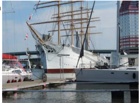
Dure jachthaven van Gothenburg.

De volgende morgen is de eerste van de vier brugopeningstijden om 11 uur. We verhuizen naar de wachtsteiger, waar al een zeiljacht ligt. Via de VHF horen we dat ze wachten op een groot schip en als die er door is mo-