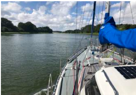
In het Noord- Oostzeekanaal.

Het is rustig zeilweer met een windje tussen de 10 en 16 knopen. We wisselen om beurten en als het weer licht wordt varen we de ingang van de Elbe op. Nabij Cuxhaven besluiten we door te varen naar de sluisen bij Brunsbüttel. Daar varen al meerdere bootjes rondjes en even later mogen we de sluis in en zijn rond de middag op het Noord-Oostzeekanaal. Op ons gemak motorren we het 40 km verderop gelegen ingang van het Gieselau-kanaal en vinden een mooi plekje in de zon voor het sluisje. Doe wat kleine reparaties o.a. aan