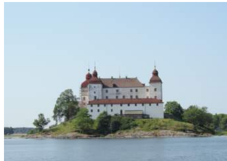
Slot Läckö bij het wegvaren.

De volgende morgen melden we ons in het kantoortje bij de eerste sluis,