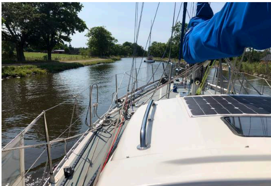
Door het Götakanaal.

Achteraf het slechtste stukje van de hele reis.