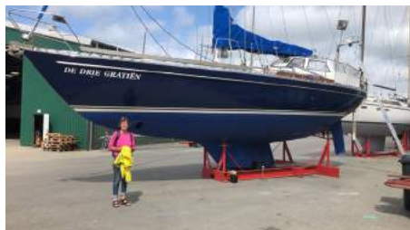
De Drie Gratiën (+1) op het droge te Fehmarn.

Vrijdagavond meren we af in het haventje van Burgstaaken tegenover de kraan van de Weilandts werf. Aan de kant waar we liggen is een leuk café-restaurant met een mooi terras, waar we een wijntje nemen en morgen zien we wel weer.