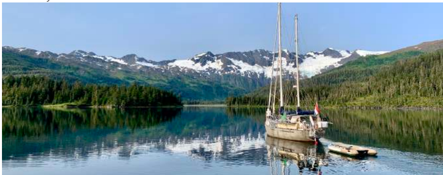
Bettles Bay Alaska