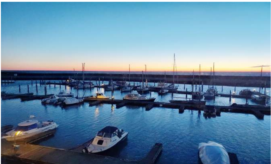
Vlak voor zonsopkomst over de Noordsteigers..