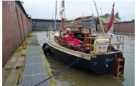
Op naar de Oostzee..

Zo voeren we ook eens in april door het Oostzeekanaal. Bij de brug van