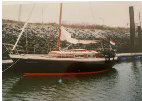
Heintjevaer vroeg eruit...

De naam van de boot is Heintjevaer. In vele havens wordt ons gevraagd wat Heintjevaer betekent. Echte Texelaars kennen het verhaal erachter. Vroeger probeerden ouders hun kinderen bij het water(achter diek of plassen en sloten) weg te houden en werden ze bang gemaakt met het verhaal van Heintjevaer. Als je te dicht bij het water kwam dook Heintjevaer op, pakte je bij je benen en trok je onder water. De sage die er aan ten grondslag ligt is deze: Een Texelse zeeman Heintje sloeg over boord terwijl hij rond de Kaap voer en verdronk. Zijn ziel vond geen rust en hij keerde terug naar de Texelse wateren en haalde zijn gram op stoute kinderen. Als kind vond je dat een erg spannend verhaal.