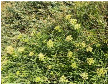
De zeer zeldzame Zeevenkel (Crithmum maritimum) groeit zomaar in onze haven.

Dus als je je beschikbaar wilt stellen om bij gelegenheid te assisteren bij reparatie of onderhoudswerkzaamheden aan de bezittingen van de vereniging. Dan kan je je bij mij opgeven via de mail, telefonisch, whatsapp etc. Vriendelijke groet en hopelijk tot de 23 e .