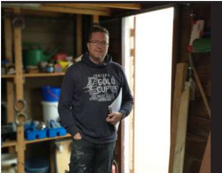
Jabik met een plan

Het jaar 2020 was voor ons als zeekanovaarders en vele anderen met ons, een vreemd en abnormaal jaar. Corona, maar ook nog eens de Kanoloods / Het Ruim tegen de vlakte. Die stond in de weg voor de nieuwbouw van de Waddenhaven. Dit alles leverde ons veel praktische problemen op, met als gevolg dat er afgelopen jaar veel minder tot niet gezamenlijk gepeddeld kon worden.