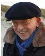
Guus Lange (redactie WT)